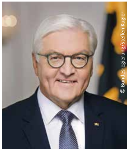
Bundespräsident Frank-Walter Steinmeier hat die Schirmherrschaft übernommen

Im Rahmen seines Profils als Europaschule wird das Burgau-Gymnasium mehrere Themenschwerpunkte zu den Bereichen „Rassismus“ und „europafeindliche Nationalismen“ ins Programm aufnehmen, unter Mitwirkung von Integrations- und Antisemitismusbeauftragten.