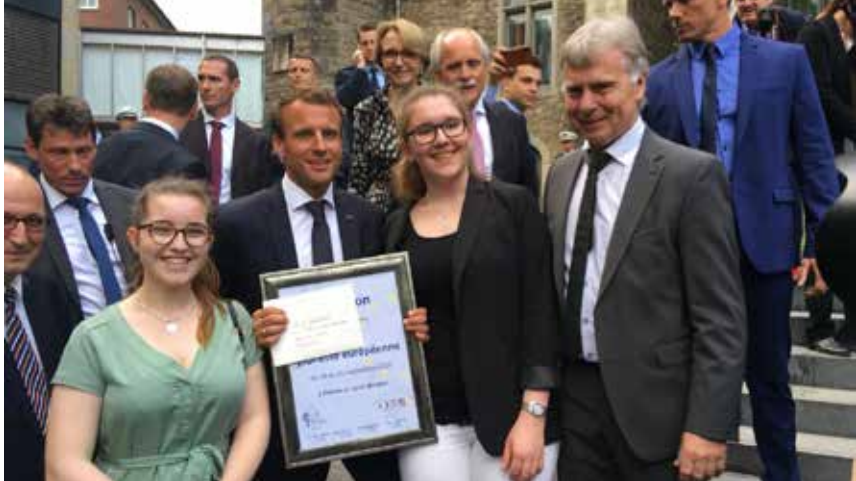
Präsident Macron mit Schülerinnen des Burgau-Gymnasiums und dem Schulleiter, nach der Übergabe der Einladung beim Karlspreis-Fest

Die Begegnung der Jugendlichen aus ganz Frankreich, Deutschland und weiteren europäischen Ländern steht ganz im Zeichen des Dialogs und des gemeinsamen Eintretens für Europa zu einem Zeitpunkt, da Europa neuen Schwung so dringend braucht.